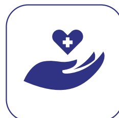
Rede de Atendimento