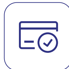
Adesão, Pagamento e Vigência