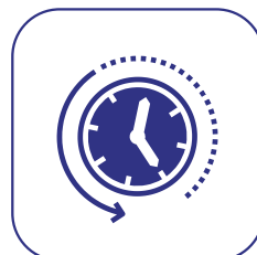
Condições para Redução de Carência