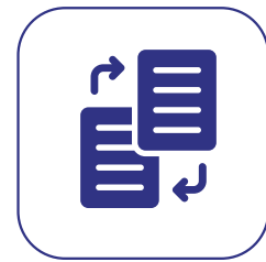
Mudança de Plano com Carência Reduzida