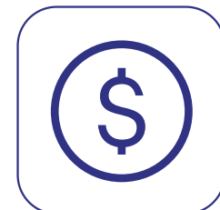
Planos sem Coparticipação e Odontológico